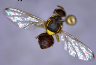
अमरूद फलमक्खी बेक्ट्रोसिरा कोरेक्टा