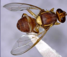
आड़ू फलमक्खी बेक्ट्रोसिरा जांटा