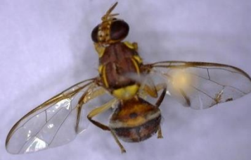
आम फलमक्खी बेक्ट्रोसिरा डारस्लिस