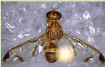
तरबूज फलमक्खी बेक्ट्रोसिरा क्यूकबिटी