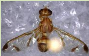
வெள்ளரி ஈ பாக்ட்ரோசீர் குகர்பிடே