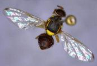
கொய்யாபழ ஈ பாக்ட்ரோசீர் கரெக்டா