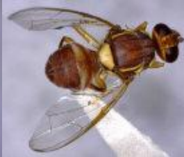
குழிப்பேரிபழ ஈ பாக்ட்ரோசீர் ஜூநேட்