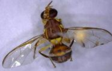
மாம்பழ ஈ பாக்ட்ரோசீர் டார்சலிஸ்